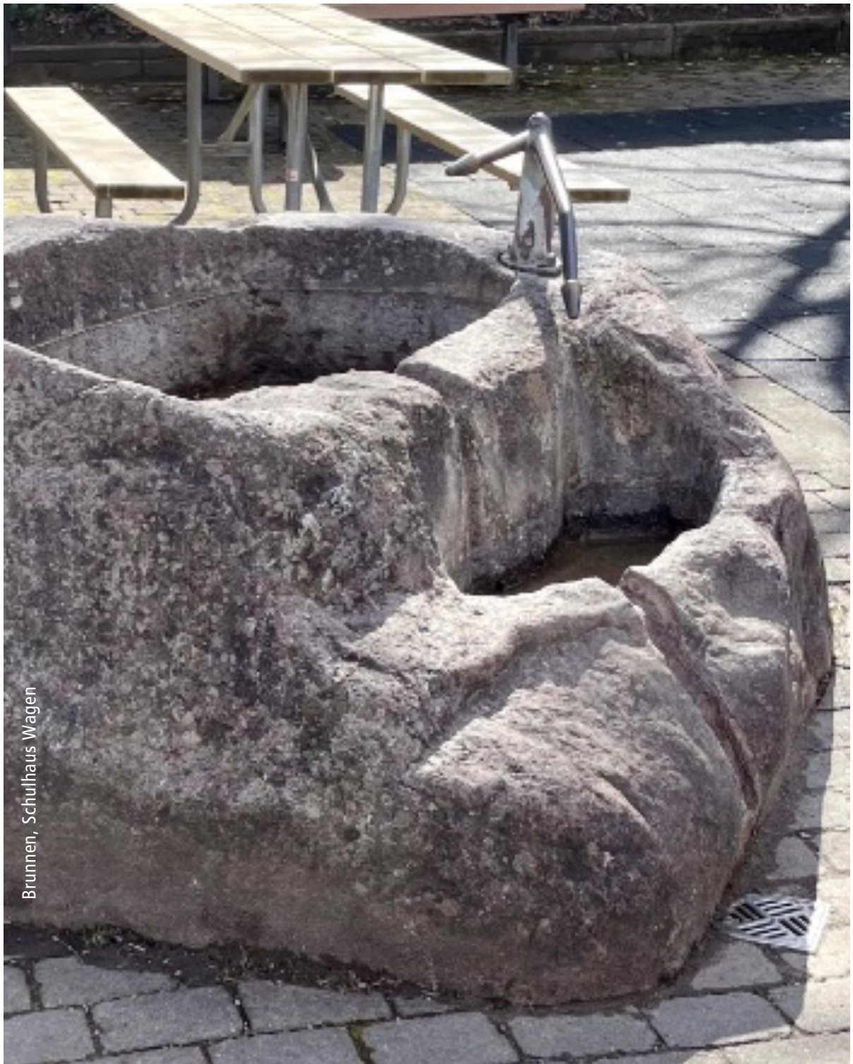
Brunnen, Schulhaus Wagen